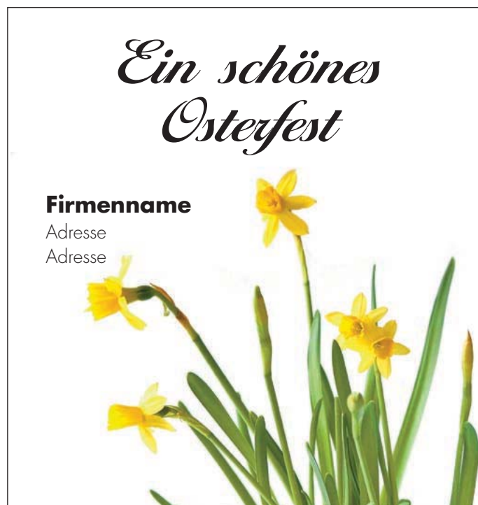
Motiv 18: 2-spaltig/95 mm, Höhe variabel