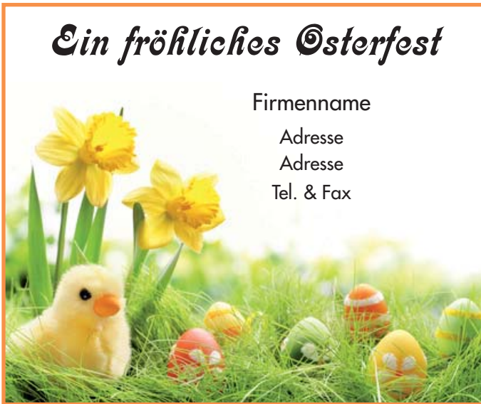
Motiv 1: 2-spaltig/75 mm, Höhe variabel