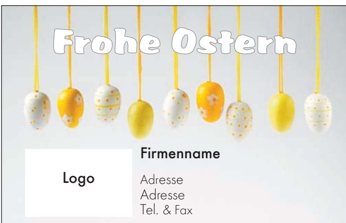
Motiv 3: 2-spaltig/57 mm