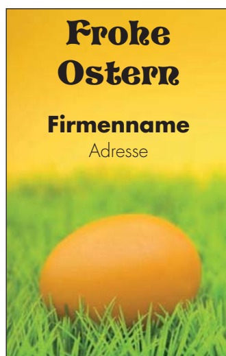
Motiv 17: 1-spaltig/68 mm

” Sie haben Ihr persönliches Lieblingsmotiv schon gefunden? Je früher Sie es uns übermitteln, um so mehr Zeit bleibt, Ihre Anzeige mit Ihnen abzustimmen.