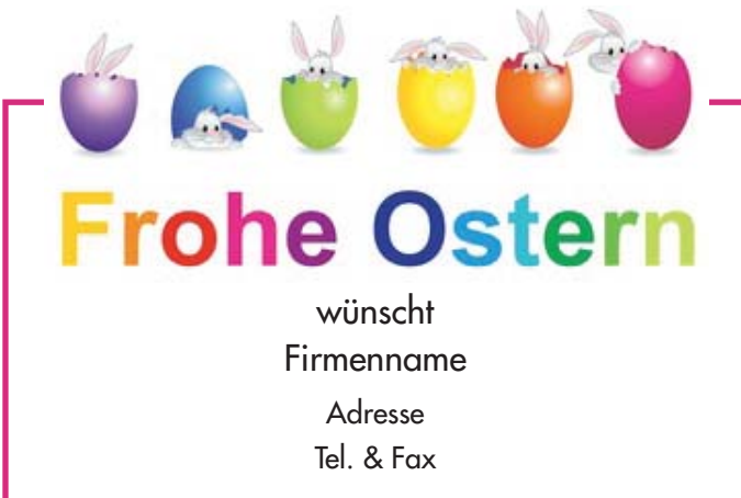
Motiv 2: 2-spaltig/60 mm, Höhe variabel