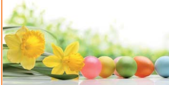
Motiv 24: 2-spaltig/70 mm, Höhe variabel