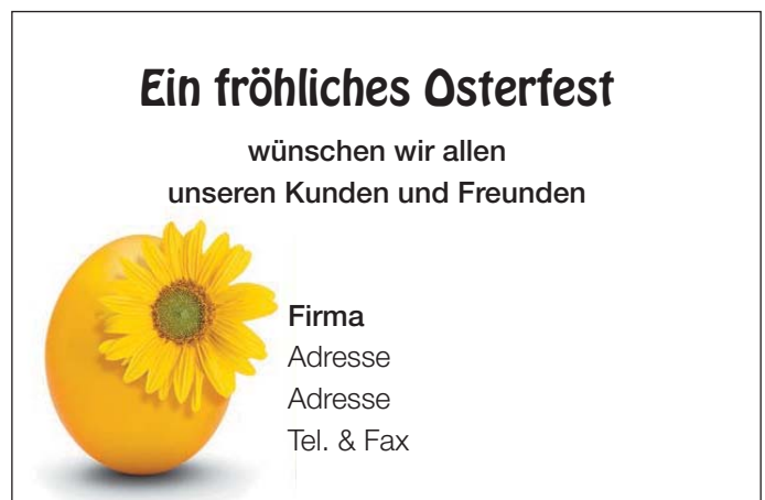
Motiv 6: 2-spaltig/60 mm, Höhe variabel