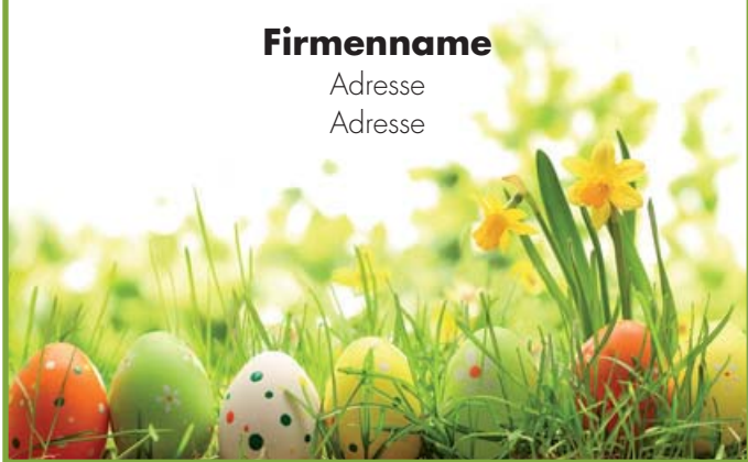
Motiv 11: 2-spaltig/80 mm, Höhe variabel