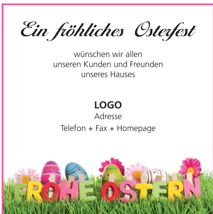
Motiv 8: 2-spaltig/90 mm, Höhe variabel

Die WILIH-Osterausgabe mit den Ostergrußanzeigen erscheint am 17. April 2019.