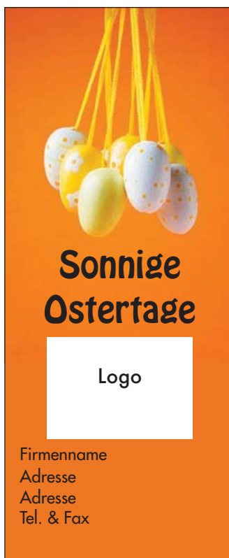
Motiv 7: 1-spaltig/105 mm, Höhe variabel