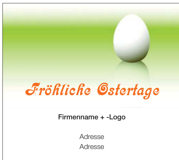
Motiv 10: 2-spaltig/80 mm, Höhe variabel