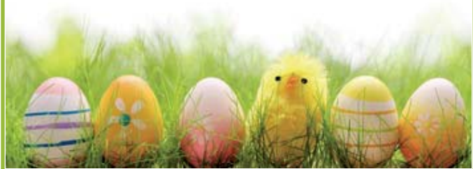
Motiv 20: 2-spaltig/90 mm, Höhe variabel