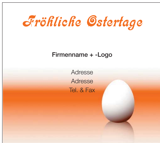
Motiv 9: 2-spaltig/80 mm, Höhe variabel