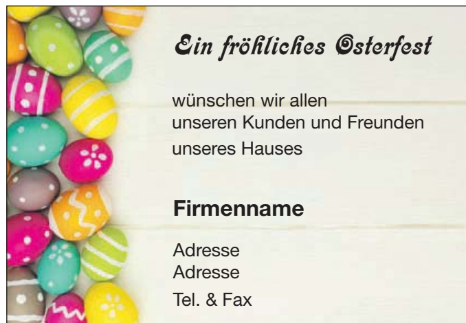
Motiv 22: 2-spaltig/62 mm

Bitte beachten Sie den Anzeigenschlusstermin : Donnerstag, 11. April 2019, 18 Uhr