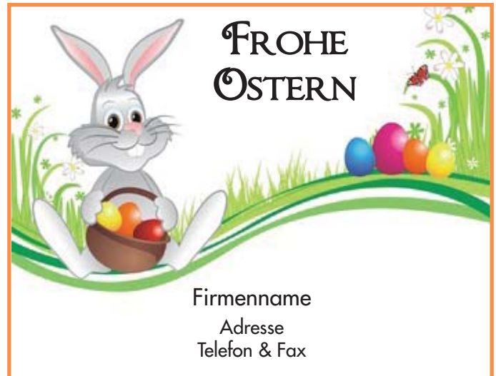
Motiv 4: 2-spaltig/70 mm, Höhe variabel