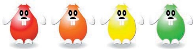
Motiv 12: 2-spaltig/75 mm, Höhe variabel