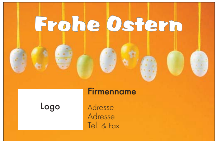
Motiv 5: 2-spaltig/60 mm