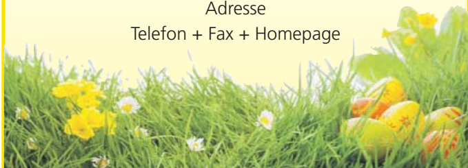
Motiv 21: 2-spaltig/58 mm, Höhe variabel