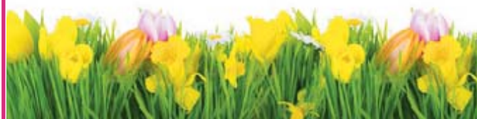
Motiv 29: 2-spaltig/70 mm, Höhe variabel