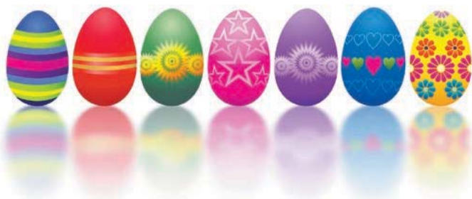
Motiv 26: 2-spaltig/80 mm, Höhe variabel