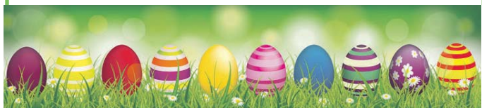
Motiv 25: 2-spaltig/60 mm, Höhe variabel