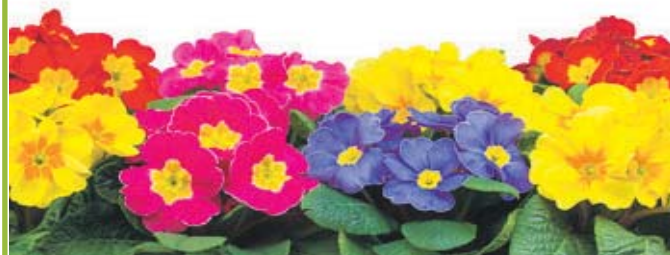
Motiv 28: 2-spaltig/70 mm, Höhe variabel