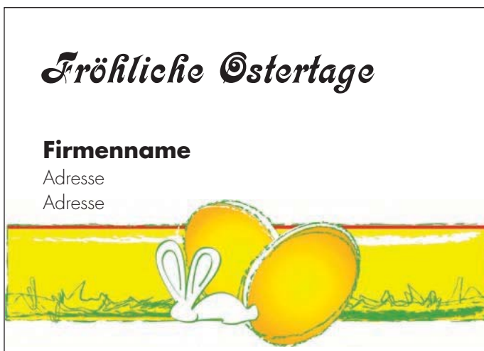
Motiv 16: 2-spaltig/65 mm, Höhe variabel